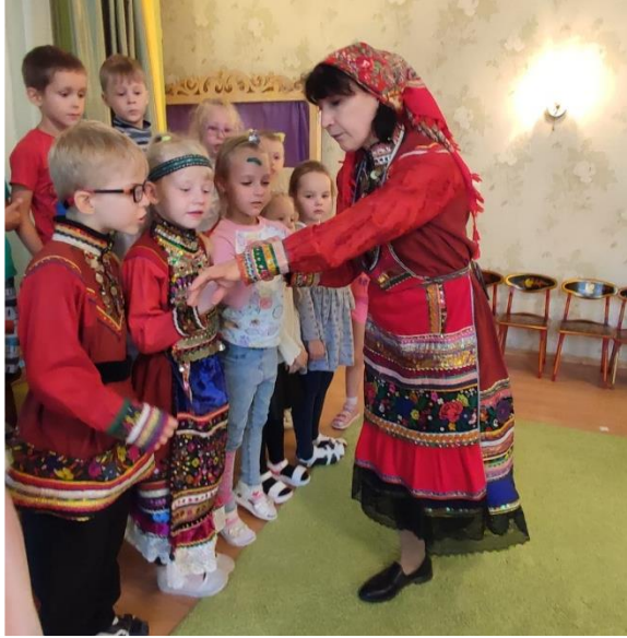
Женский марийский костюм