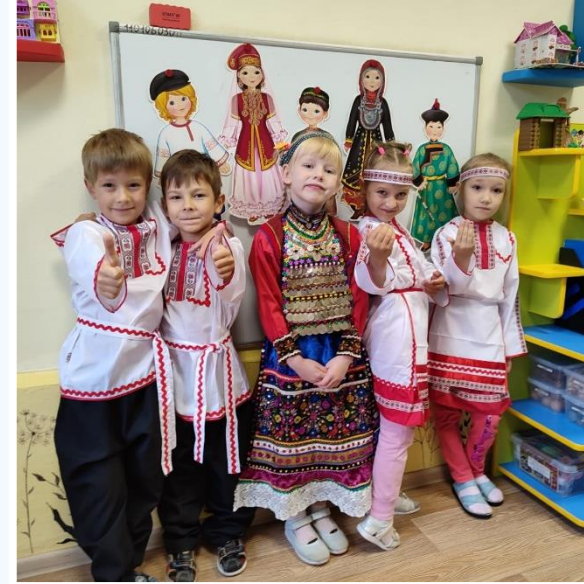
Детские марийские костюмы