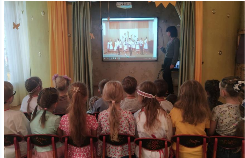
Знакомство с различными особенностями марийских танцев и песен