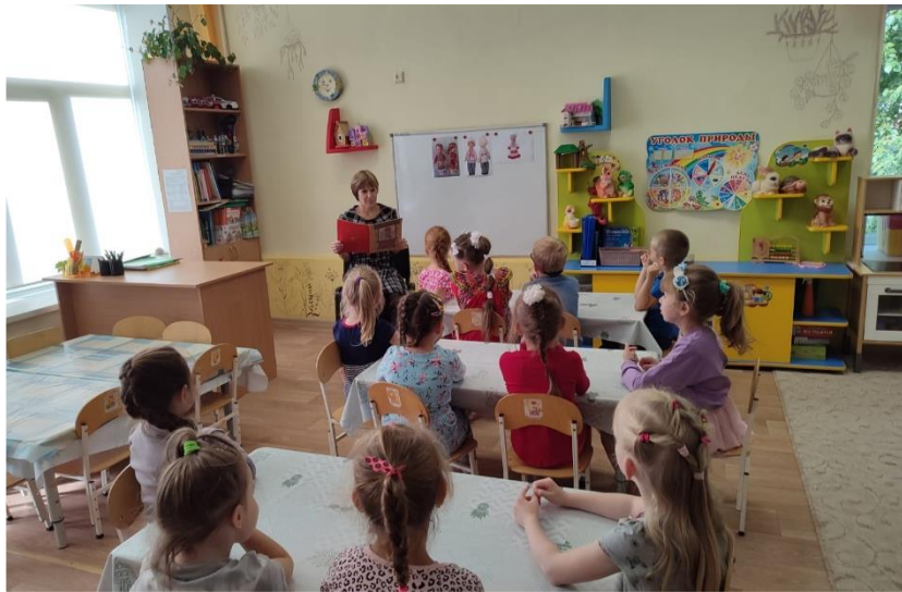
Слушание традиционной марийской сказки «Огонь и человек»