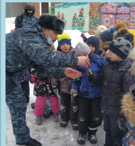
Мероприятие в рамках проекта организовано папой воспитанницы группы